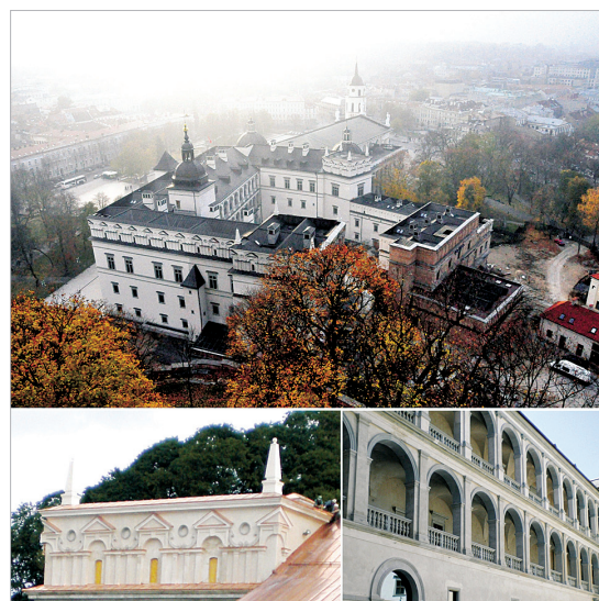
2 pav. Atkurti renesansiniai Vilniaus žemutinės pilies rūmai ir jų fragmentai: atikas ir vidinio kiemo atvira galerija su arkadomis