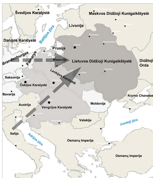
1 pav. Renesanso architektūros kelias į Jogailaičių dinastijos valdymo laikotarpio Lietuvą

Renesanso architektūrai pasiekus Lietuvą, gyvavo vietinės lietuviškos tradicijos. Tradicijos traktuojamos kaip apibendrinanti sąvoka, susiejanti objekto materialiuosius pokyčius su gyvenimo, veiklos pasikeitimais (Jurevičienė 2005). Renesanso architektūrai susipynus su vietinėmis lietuviškomis tradicijomis, jos gajais vėlyvosios gotikos bruožais, manierizmo reiškiniais susiformavo savita lietuviško renesanso architektūra, pasižyminti mišriomis formomis, paviršutiniška antikos paveldo įtaka. Lietuviško renesanso